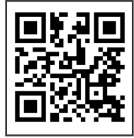
[강중침 유튜브 채널]