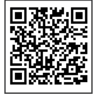
[디모데교향곡] (강중침 새벽&부목사 설교)